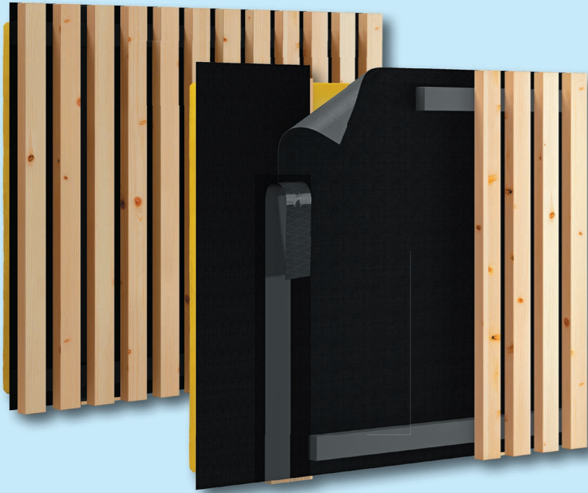
Verarbeitung der ALUJET Fassadenbahn mit dem ALUJET Difutape BLACK