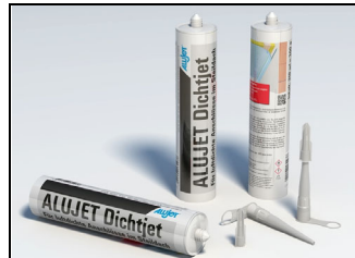
Abb. 1: ALUJET Dichtjet 310 ml